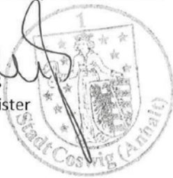
Axel Clauß Bürgermeister