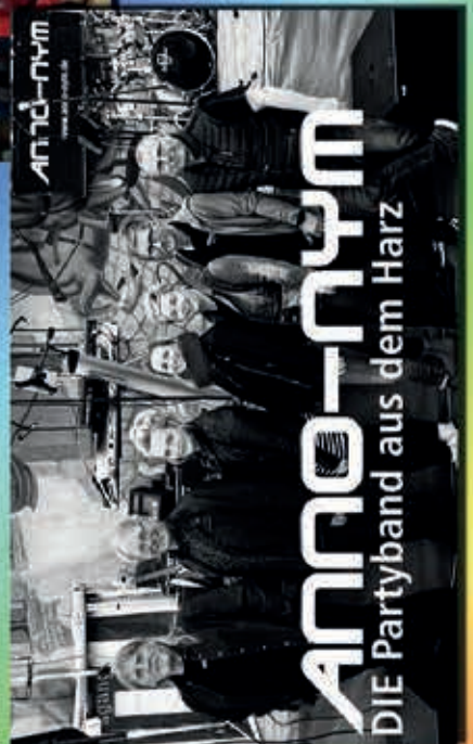
ANNO-NYM DIE Partyband aus dem Harz