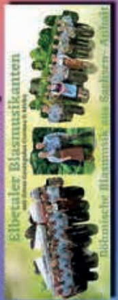
Elbeter Blasmusikanten Musikschule Coswig